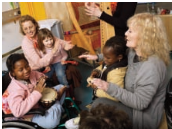
Petula Clark avec des enfants hospitalisés au CHUV, Lausanne

Petula Clark est engagée aux côtés de la fondation depuis 2009. Cette grande vedette des années 60, qui a vendu plus de 70 millions d'albums est aussi une femme de cœur comme le prouve son discours sur l'égalité raciale en 1968.